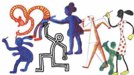
Illustrazione di Guido Scarabottolo per Il Festival del Disegno.